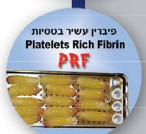
פיריין עשיר בסיטיות Platelets Rich Fibrin PRF