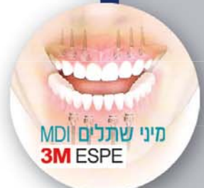
מיני שתלים MDI 3M ESPE