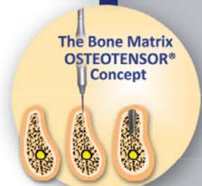
The Bone Matrix OSTEOTENSOR® Concept