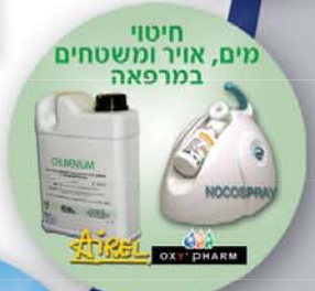
חיסוי מים, אויר ומשטחים במרפאה OXIPHARMA

בלעדי בישראל מפלנט! אנו מקיימים קורסים וסדנאות מתקדמים בהשתתפות מרצים מהמובילים בתחום