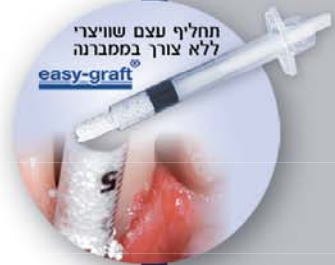
תחליף עצם שוויצרי ללא צורך בממברנה easy-graft®